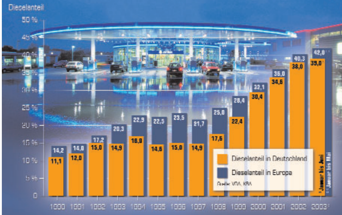
Seit 1990 hat sich der Dieselanteil bei Neuwagen in Deutschland und Europa deutlich erhöht. Manche Länder erreichen sogar Quoten von 70 Prozent.